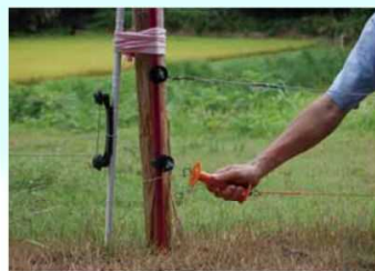
侵入防止柵の設置