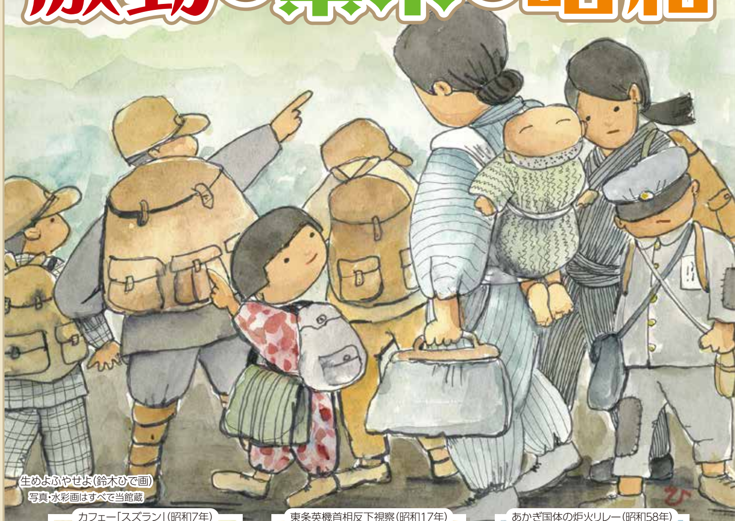
生めふぶやせよ(鈴木ひで画)