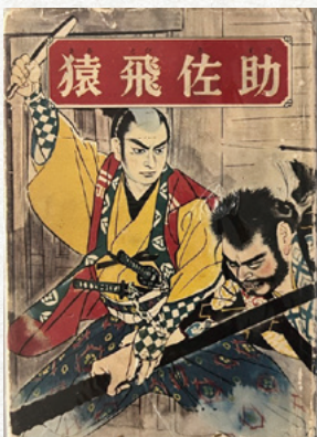
講談本 猿飛佐助 (個人蔵)

講談真田十勇士の主演で少年忍者の猿飛佐助の物語はフィクションだが、吾妻衆忍者の唐沢玄蕃・横谷左近をモデルにしたという説がある。唐沢家(群馬県中之条町)と横谷家(長野県上田市)には、それを裏付けるような文献や武器などが伝わっている。