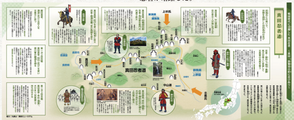
真田忍者道 (協力:九度山・真田ミュージアム)

真田幸隆・昌幸は岩櫃城攻防戦、嵩山合戦で調略により上杉勢を撃破。後の北条軍との激戦でも忍者が暗躍した。