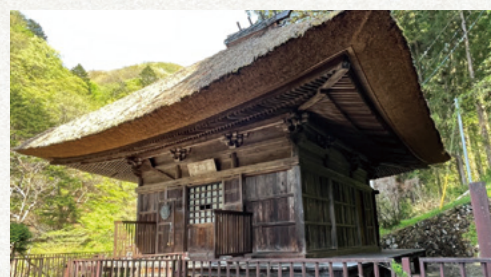
日向見薬師堂 (中之条町四万)