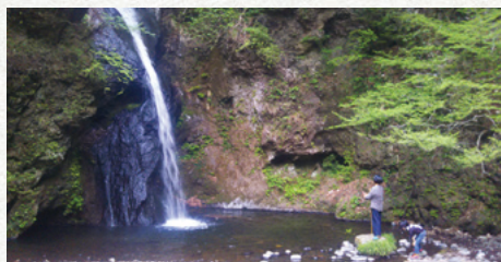
修験道場 不動滝 (東吾妻町)

吾妻は修験道が盛んな地域であった。修験者は永い間住民と深い関係を持ち、その教化のみならず、医療・呪術は申すに及ばず、深く農民生活のなかにとけこみ、戦時には諜報、文筆、その他の面においても幅広く活動していた。