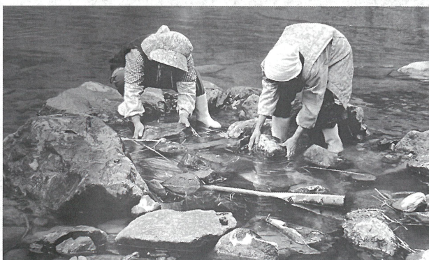
ネドフミとスゲ細工の技術 (尻焼温泉・花敷温泉)