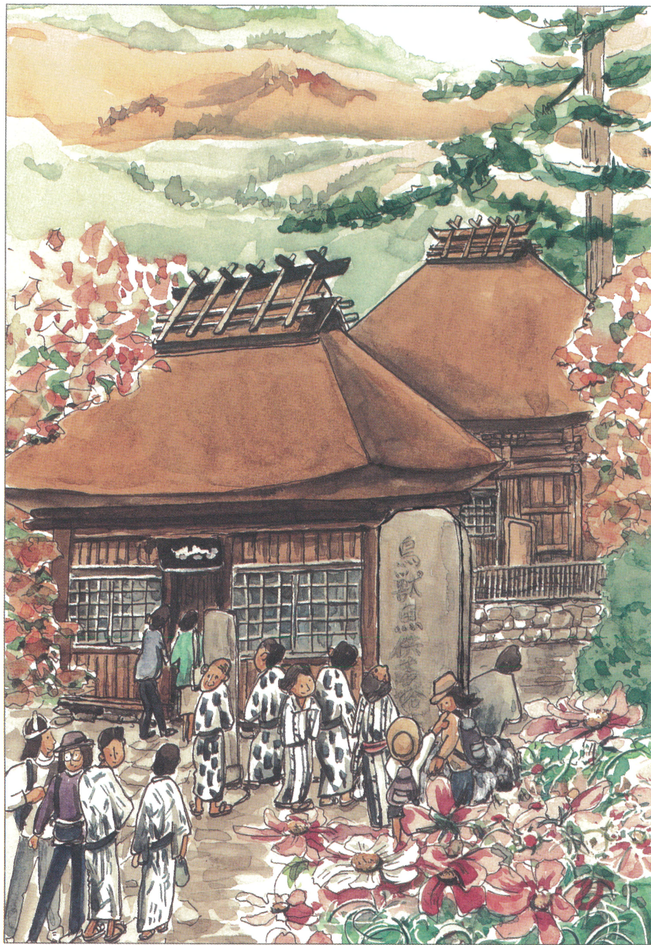
「日向見薬師堂(重要文化財)」