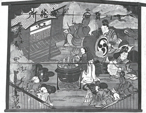
日向見薬師堂絵馬 (四万温泉)

吾妻郡内の代表的温泉、草津・四万・沢渡・尻焼等の温泉郷には、古くから伝承されてきた温泉文化があります。また、明治中期まで草津温泉で行われた「冬住み」や、六合入山の川床源泉を利用したスゲ細工の伝承技術「ネドフミ」も当地のユニークな温泉文化です。