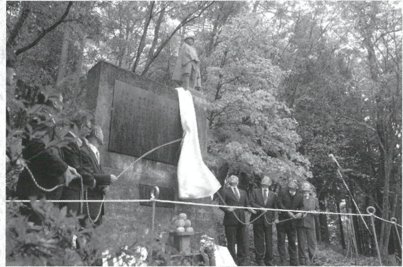
牧水祭 (2017年 中之条町・暮坂峠)

大正11年(1922)若山牧水が峠で「枯野の旅」の詩を詠んだことを記念して10月20日に牧水祭が行われます