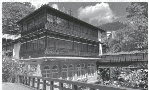
積善館の前新・廊下橋 (四万温泉)