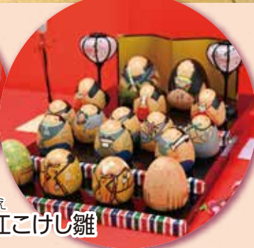
ひろえ 汪江こけし雛