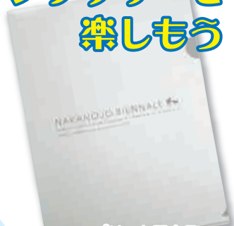
コンプリート記念品 オリジナルクリアファイル

今回、スタンプラリーが復活しました。会場ごとにスタンプのデザインが違うので全制覇したくなっちゃうこと間違いなし。もちろん、コンプリートした人にはオリジナル記念品をプレゼントします。さらにアンケートに答えると温泉宿泊券が当たる抽選にも参加できます。台紙は旧廣盛酒造、旧第三小学校、旧沢渡館、イサマムラ、お蚕さんの里などでもらえます。作品を鑑賞しながら、記念品もゲットして一石二鳥でお楽しみください。