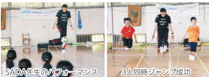
SADA先生のパフォーマンス