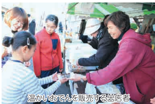
温かいおでんを販売する出店者

第9回中之条まちなか5時間リレーマラソンを地元のおいしい「食」と「おもてなしの心」で盛り上げてくれる出店者を大募集します!