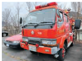
三菱ふそうキャンター