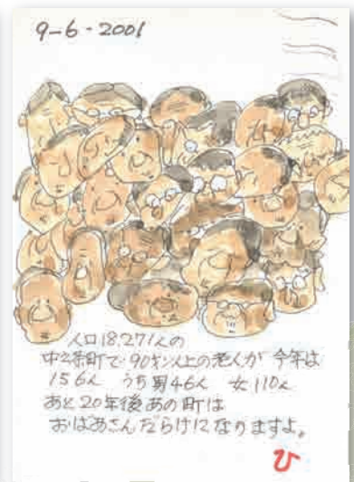
高齢化社会(平成13年9月6日)

博物館「ミュゼ」では年中行事や子どもの遊びなどの写真や記録を探しています。お持ちの人は資料提供にご協力ください。 問い合わせ 歴史と民俗の博物館「ミュゼ」