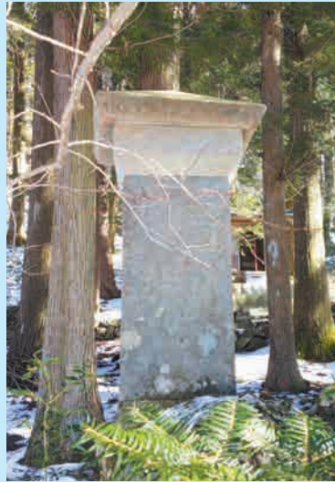
上野国稲裏地神の碑

享和3(1803)年、真滝は稲包山に登り、翌年には山頂に石祠を建てました。そして登山口である四万温泉の議業に小さな社を建て中社として祀り、かつて吾妻郡衙の郡司であった上毛野坂本朝臣直道に信仰された大宮殿鼓神社を里宮と位置づけました。さらに真滝は、稲裏地神を顕彰するために、議業の稲裏神社境内に、「稲裏地神の碑」を建立しました。建てたのは、文化3(1806)年4月。中之条町山