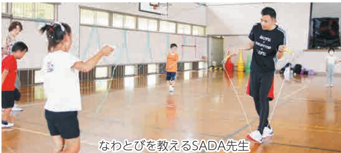
なわとびを教えるSADA先生