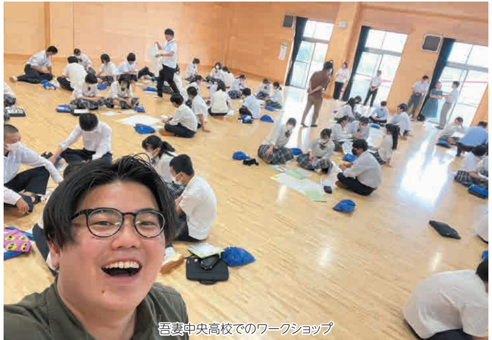
吾妻中央高校でのワークショップ

茨城県桜川市出身。地域おこし協力隊3年目、宇都宮大学大学院地域創生学科研究科1年生。大学3年時に地域おこし協力隊として中之条町に着任。現在、学生と協力隊、2足のわらじで頑張っています。