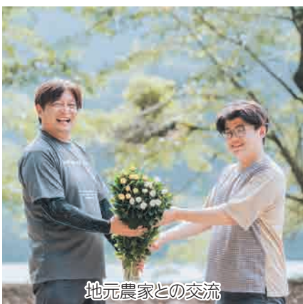
地元農家との交流

また、事務所として群馬銀行近くの「旧野村荒物店」を活用しています。「地域のたまり場」「地域と地域外が交流する場」を目指していますので、ぜひお立ち寄りください。