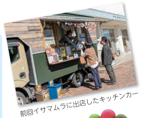
前回イサマムラに出店したキッチンカー

今回は、グルメも楽しんでもらうため、日替わりでキッチンカーが出店する「日替わりマルシェ」を開催します。県内から集まった約30店のキッチンカーが、毎日交替で出店しているので、いろいろなグルメを楽しむことができます。出店会場は、イサマムラ、やませ、お蚕さんの里です。出店者は毎日変わるので公式ホームページ、SNSで確認してから来てください。