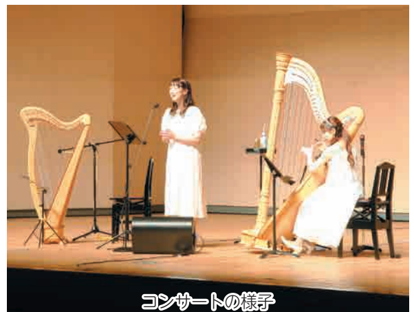
コンサートの様子

美しい音色で奏でられた音楽は、古楽から現代音楽、ポップス、ミュージカルなど様々なジャンルで演奏され、観客たちの耳を楽しませていました。