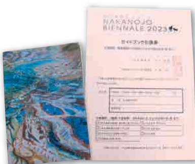
公式ガイドブック(左)と引換券(右)