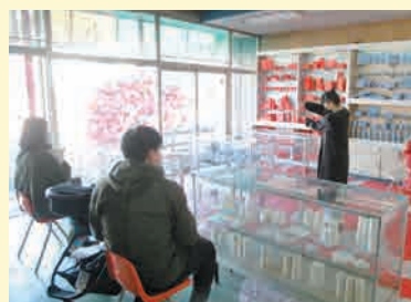
中之条ビエンナーレ2021