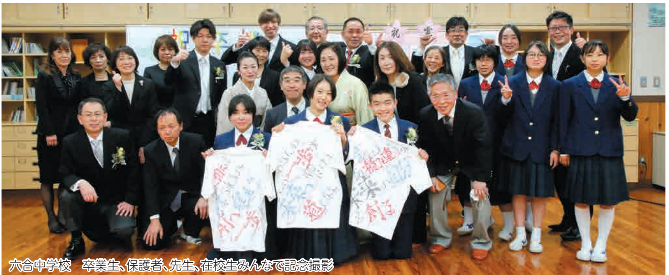
六合中学校 卒業生、保護者、先生、在校生みんなで記念撮影