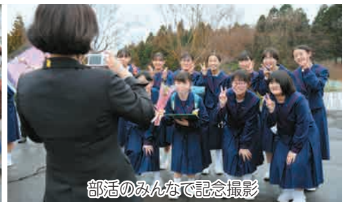
部活のみんなで記念撮影