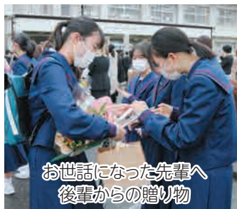
お世話になった先輩へ 後輩からの贈り物

今年の卒業生は、新型コロナウイルスの流行と同時に入学し、3年間さまざまな困難を乗り越えて卒業式を迎えた生徒たちです。制約がある中でも前を向き、コロナ禍の中でしか得られない経験をした生徒たちは、それぞれの道を歩み出します。卒業生の皆さん、これからも応援しています。