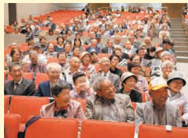
慶朗会(令和元年度)