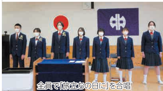
全員で旅立ちの日にを合唱