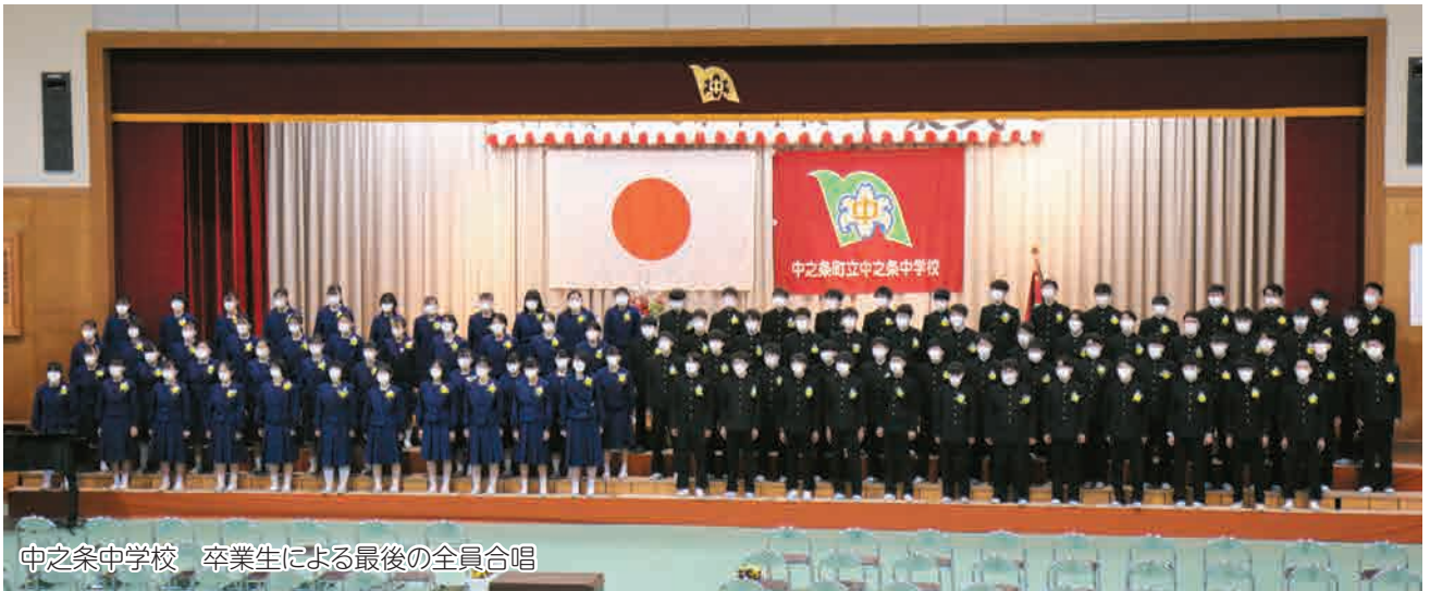
中之条中学校 卒業生による最後の全員合唱

3月13日、中之条中学校、六合中学校で卒業式が行われました。今年卒業した生徒は、中之条中学校107名、六合中学校3名。