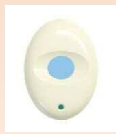
○ペンダント型送信機