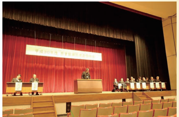
(7) 吾妻振興局県政説明会