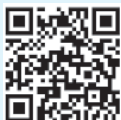
議会ホームページ QRコード

会議録や議員ごとの視察研修報告、本会議の録画配信をご覧いただくことができます。また、フェイスブックページも開設していますので、ぜひご覧ください。議会ホームページURL https://www.town.nakanojo.gunma.jp/gikai/ 議会 Facebook URL https://www.facebook.com/Nakanojo.Gikai/