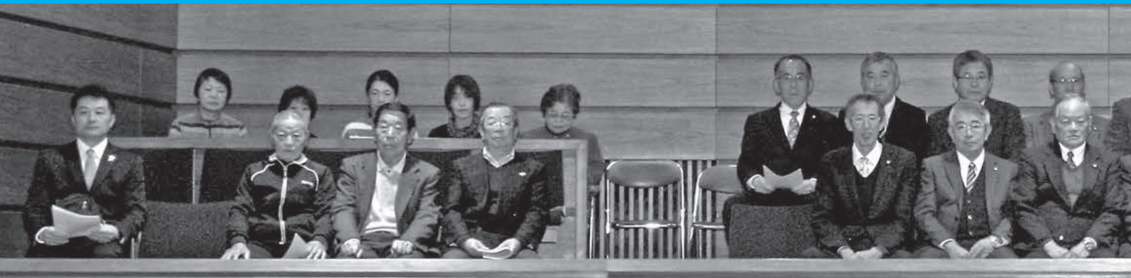
本会議2日目(総括質疑:3月18日)の傍聴席