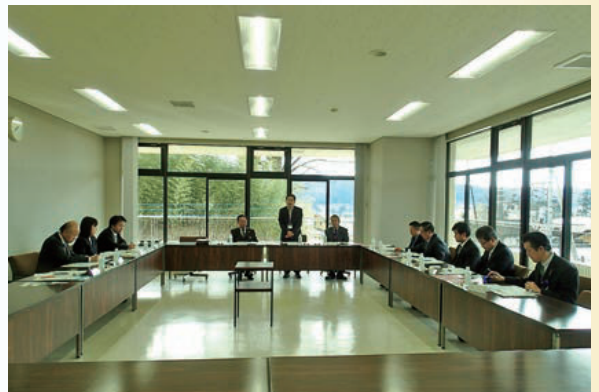
(14) 群馬県神流町議会視察受入 (再生可能エネルギー事業について)