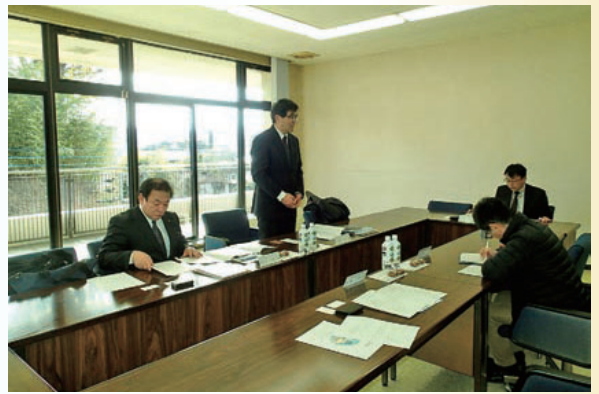
(3) 栃木県鹿沼市議会視察受入 (中之条ピエンナーレ事業について)