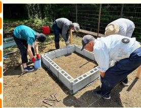
第1回(土台作り) 土台となるコンクリート ブロックを並べました。

8月2日から石窯作り体験会を開催し、9月までに計5回開催しました。完成まであとわずかです！