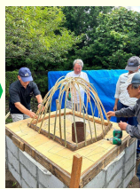
第3回(ドーム作り) 細い竹で型を作ります。