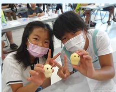
作った作品とピース

人気講座「おちゃっぴ先生のねんど教室」を今年も開催しました。今年も、午前と午後合わせて約120人の親子が参加しました。