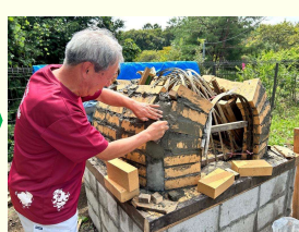
第4回(ドーム作り) レンガを積み上げて いきます。