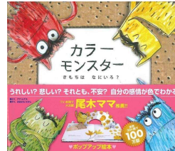
「カラー モンスター」 アナ・レアス 作 大友 剛 訳