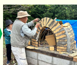
第5回(ドーム作り) さらにレンガを積み 上げていきます。