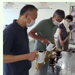
初めてのカップング体験

「美味しい珈琲の楽しみ方講座」煎り方の違う豆の違いを学んだり、実際にドリップの仕方や、コーヒーを評価判断するカップングを体験しました。