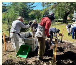
第2回(土台作り) コンクリートブロック の中に土を入れます。