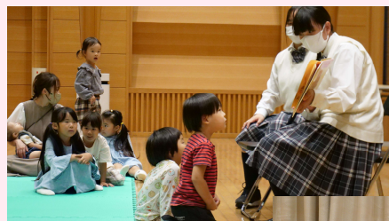
吾妻中央高校の みなさんによる 読み聞かせ

町内から6団体が集まり、おはなしフェスティバルを開催しました。初参加だった吾妻中央高校のみなさんも工夫しながら読み聞かせをしてくださいました。参加した子どもたちは、絵本に合わせて手遊びをしたり歌を歌ったりしてとても楽しそうでした。