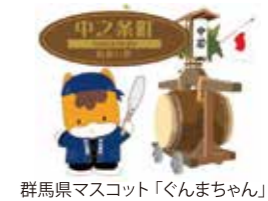
群馬県マスコット「ぐんまちゃん」