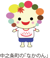
中之条町の「なかのん」